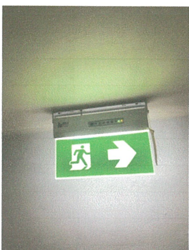
ป้ายทางหนีไฟ