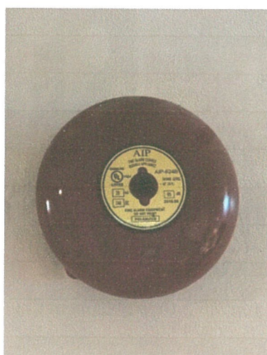
กริ่งสัญญาณเตือนภัย