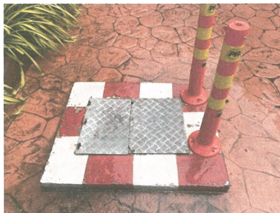
รูปภาพที่ 2.6 ถังเก็บน้ำดิบสำรอง