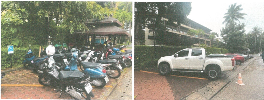
รูปภาพที่ 2.3 พื้นที่สำหรับจอดรถ