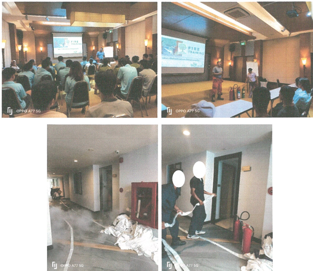
รูปภาพที่ 2.10 การซ้อมอพยพหนีไฟ