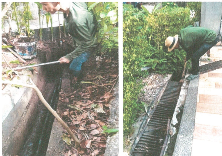
รูปภาพที่ 2.7 การขุดลอกตะกอน