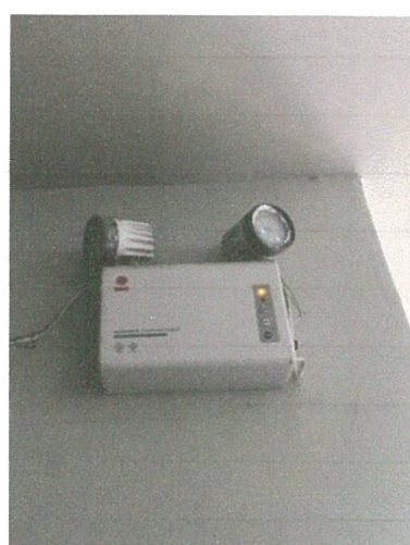
ไฟฉุกเฉิน