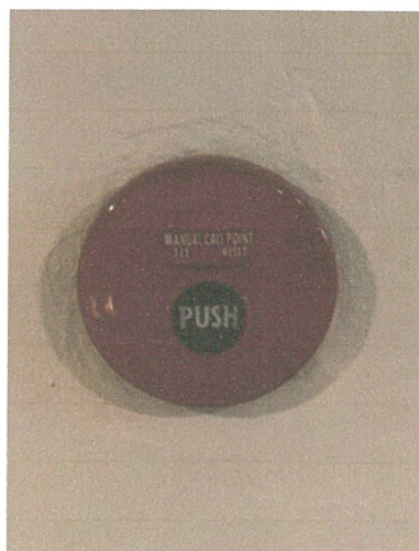
อุปกรณ์แจ้งเหตุด้วยมือ