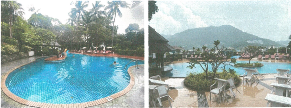
รูปภาพที่ 2.5 สระว่ายน้ำโครงการ