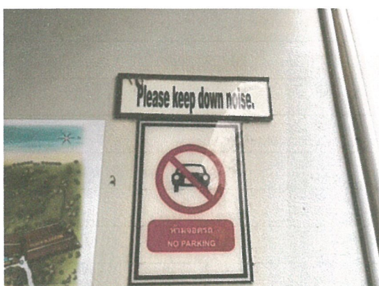
รูปภาพที่ 2.11 ป้ายห้ามจอดรถ