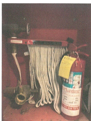
ตู้อุปกรณ์ดับเพลิง