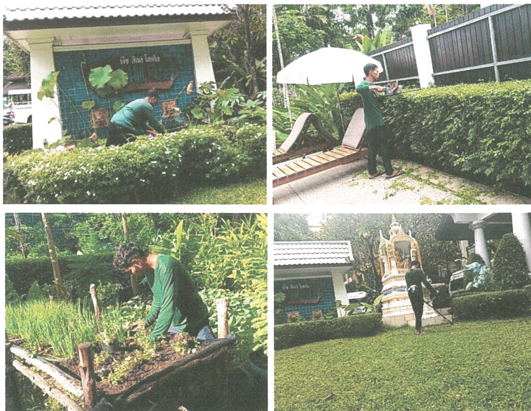
รูปภาพที่ 2.2 งานดูแลสวน