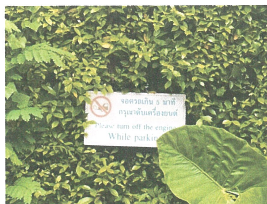
รูปภาพที่ 2.12 ป้ายดับเครื่องยนต์