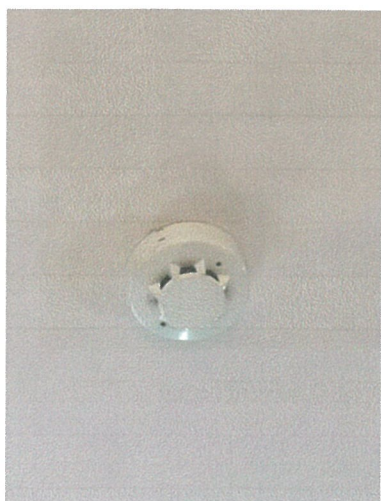
อุปกรณ์ตรวจจับควัน