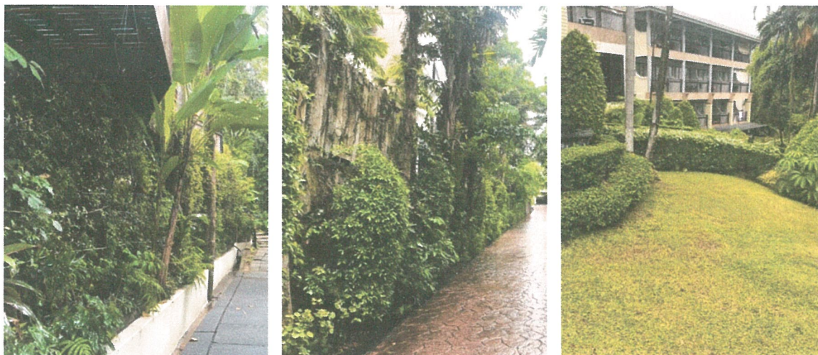
รูปภาพที่ 2.1 พื้นที่สีเขียวภายในโครงการ