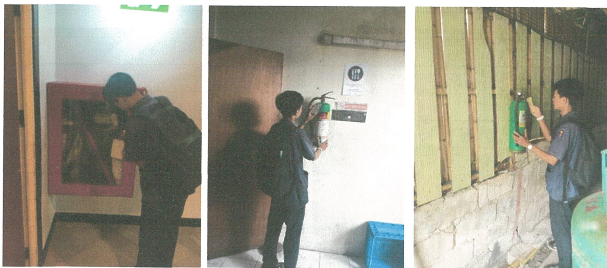
รูปภาพที่ 2.8 การตรวจสอบอุปกรณ์ป้องกันและแจ้งเตือนอัคคีภัย